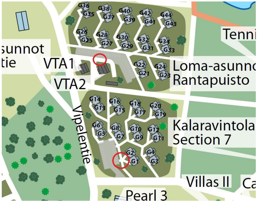
Waste containers marked in red circles